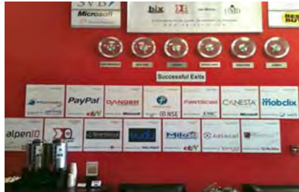
写真1 (左) レセプション前のフロアの様子、(右) 壁には卒業企業のパネルが追加されていく