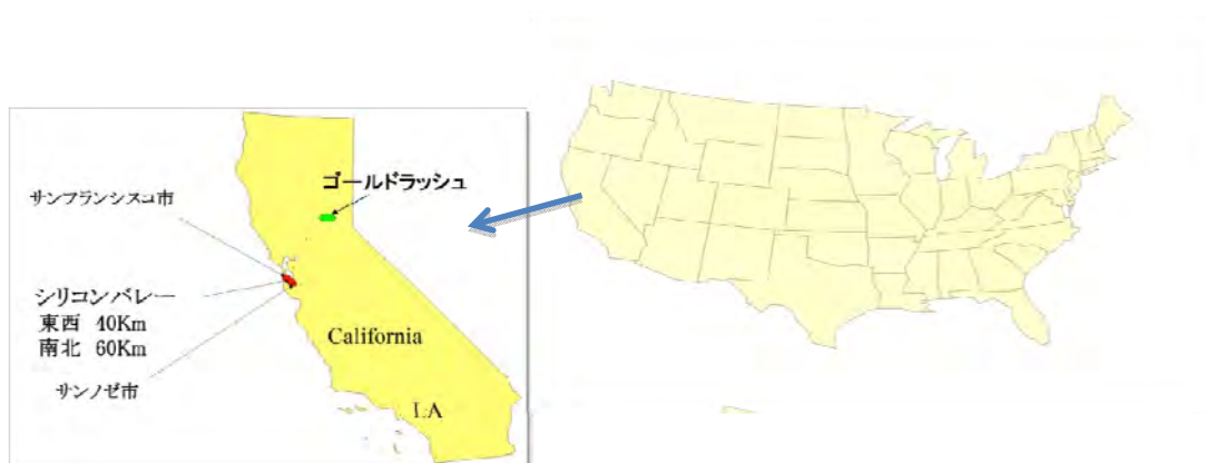
図1 シリコンバレーの地理

シリコンバレー (以下 SV) とは、カリフォルニア州 (以下 CA) のサンフランシスコ湾の西側に位置し、サンフランシスコ市とサンノゼ市の間広がるハイテク・スタートアップが多く輩出される地域である (図1を参照)。1938年、スタンフォード大学の卒業生