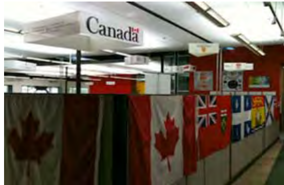
写真2 (左) MIT、ハーバード、スタンフォードといった各大学のピッチコンテストのスケジュール等が掲示されている、(右) カナダパビリオンは、スタートアップを3ヵ月ショートステイさせる